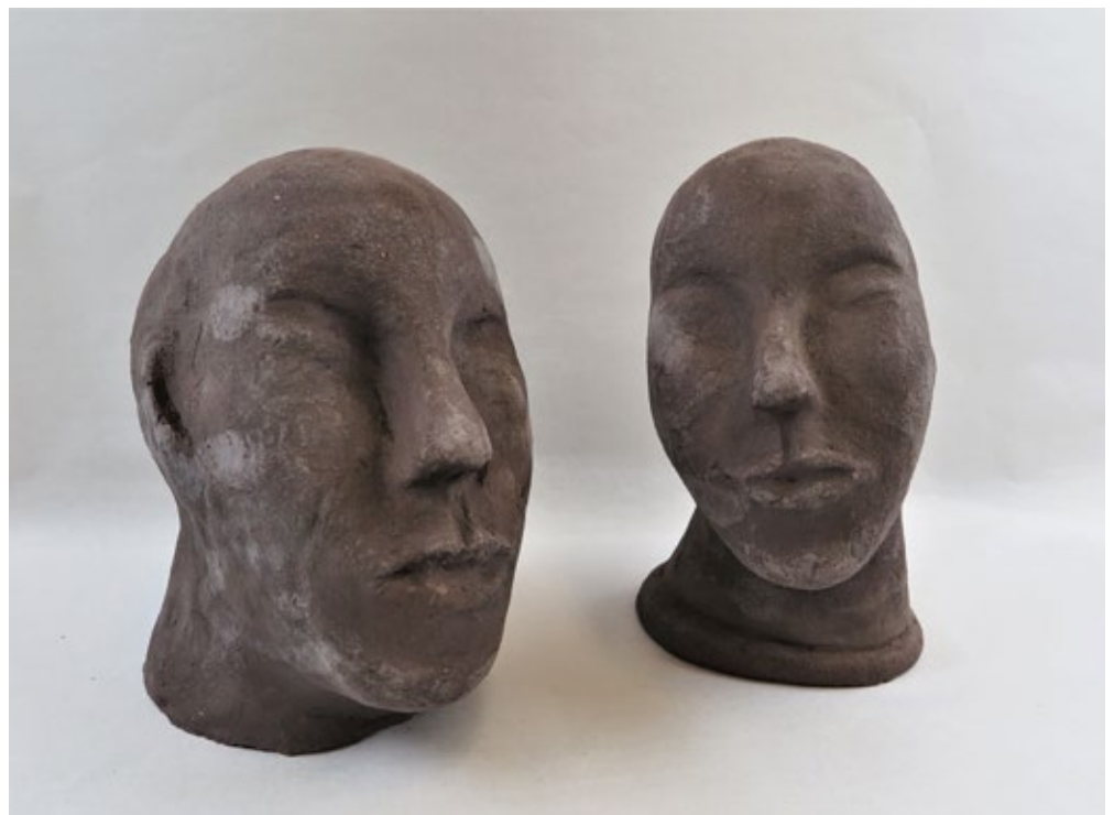
J. G.: «Köpfe»